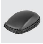
Transporttasche für CadMouse Wireless