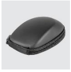
Transporttasche für CadMouse Wireless