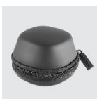
Transporttasche für SpaceMouse Wireless