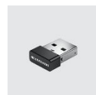
3Dconnexion Universal Receiver