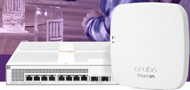
1930 8G POE KLASSE 4 2SFP