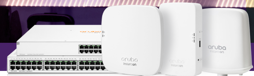
1930 24G 4SFP/SFP+/ 48G 4SFP/SFP+ AP12 AP11D AP17

WLAN-Erfahrung auf den Zimmern gewünscht sind. Die Instant On-Switches der Serie 1930 mit 24 und 48 Ports sind ideal, um Geräte wie Überwachungskameras, WLAN-Access Points und intelligente Türschlösser zu betreiben. Sie erhalten eine robuste und kosteneffektive Netzwerklösung, die Zufriedenheit bei Gästen und Belegschaft sicherstellt. Besser noch: dank einfacher Softwareabstimmung ist gewährleistet, dass von Streamingdiensten über Sicherheitskameras bis hin zu betriebswichtigen Systemen alles harmonisch zusammenarbeiten kann.